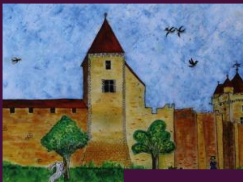
Extrait affiche du May mé Seine-e