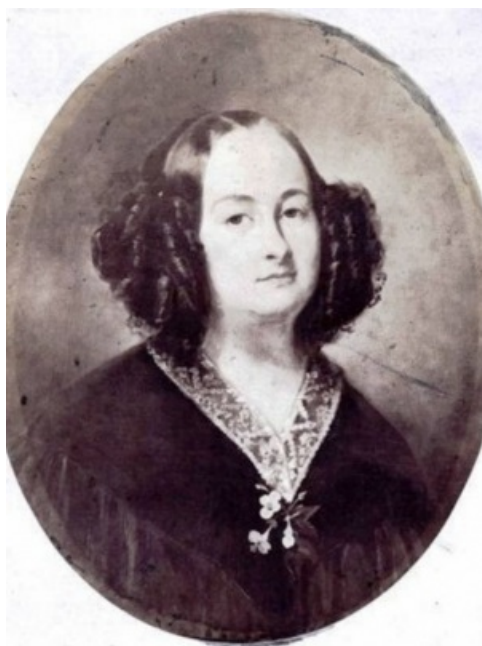
Portrait de Françoise Altarice Rosalba Sébastiani Duchesse de Choiseul

Au petit matin du 18 Août 1847 , en pleine Monarchie de Juillet, une terrible nouvelle se répandit dans la capitale : un crime avait été commis durant la nuit chez le Duc de Choiseul-Praslin, Pair de France et conseiller du roi Louis-Philippe. Ce fut au N°55 rue du Faubourg Saint-Honoré, dans l'hôtel particulier du Maréchal Sébastiani, à Paris, que se déroula le drame. La résidence était occupée par la fille du Maréchal, la Duchesse Françoise Altarice Rosalba Sébastiani de Choiseul-Praslin (dite Fanny pour les intimes), et son époux le Duc Charles Laure Hug