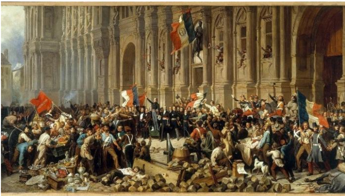
Lamartine devant l'Hôtel de Ville de Paris refuse le drapeau rouge (25/02/1848) par Henri F. E. Philippoteaux